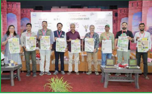
संमेलनाच्या उद्घाटनप्रसंगी निसर्गकट्टा, अकोला तर्फे तयार केलेली पक्षी विषयावरील दिनदर्शिकेचे प्रकाशन सहभागी पक्षीमित्र व मान्यवरांच्या हस्ते झाले