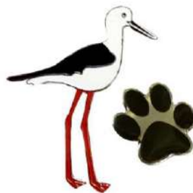
Birds and Mammals