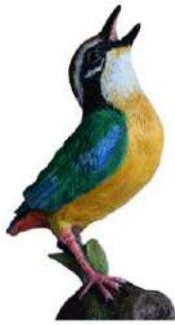
Birds & Mammals