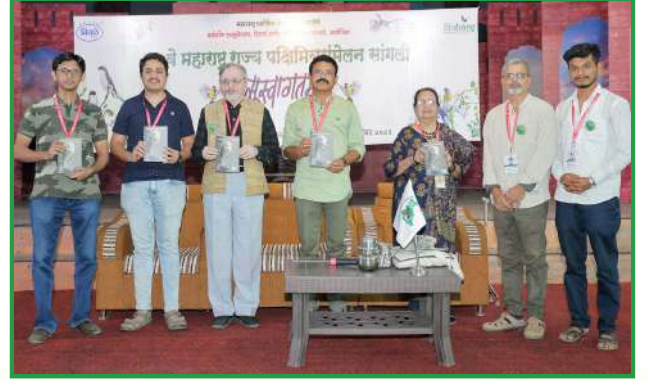
सांगली जिल्हा पक्षी मार्गदर्शिका या पुस्तकाचे प्रकाशन संमेलनात करण्यात आले. हे पुस्तक संमेलनात सहभागींना विनामूल्य देण्यात आले.