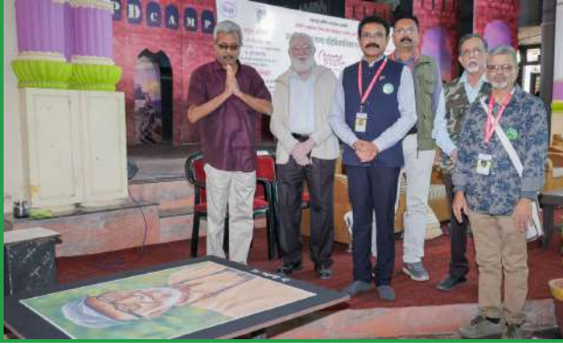
३६ व्या महाराष्ट्र पक्षिमित्र संमेलनाच्या उद्घाटनप्रसंगी डॉ. सालिम अली यांच्या भव्य रांगोळीचे अनावरण करतांना मान्यवर.