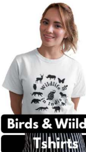
Birds & Wildlife

Information of various Wildlife Resorts across India, Wildlife Tours and Wildlife News