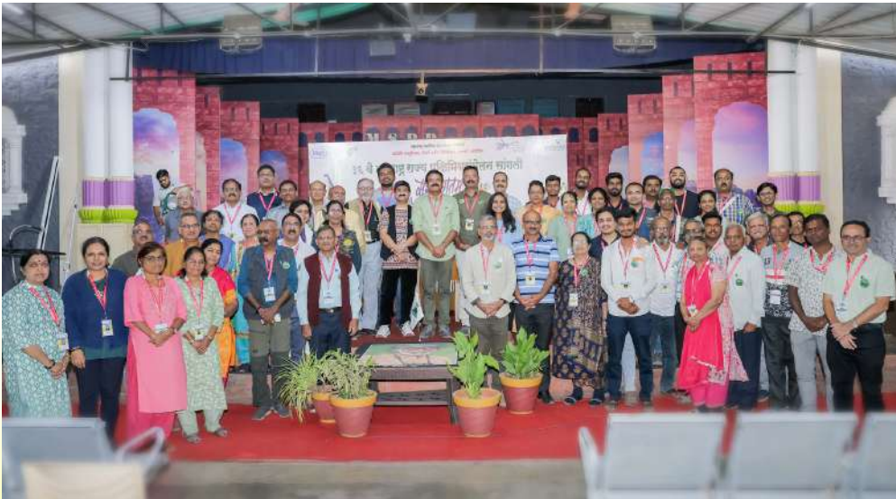
सांगली येथील ३६ व्या संमेलनाच्या समारोप प्रसंगी काढलेले समूह छायाचित्र