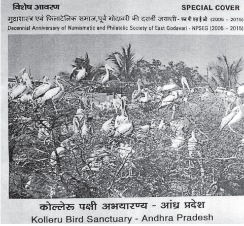
कोल्लेरू पक्षी अभयारण्य - आंध्र प्रदेश Kolleru Bird Sanctuary - Andhra Pradesh

हिवाळ्यात असंख्य स्थलांतरित पक्षी या तलावावर आश्रयास येतात. त्यात ग्लाॅसी आयबिस, पेंटेड स्टॉर्क, ग्रे पेलिकन्स, एशियन ओपन बिल स्टॉर्क्स, व्हाइट आयबीस, टील्स, पीनटेल्स, शॉव्हेलर्स, रेड क्रेस्टेड पोचार्ड, ब्लॅक विंग स्टिल्ट, अॅव्होसेट, विजन्स, गडवाल्स, कॉर्मोरंट्स, रेड शॅक्स, गार्गनी, हेरॉन्स व फ्लेमिंगोज इ. या तळ्यात २ लाखांच्या संख्येने स्थानिक व स्थलांतरित पक्षी आश्रयास येतात. हे तळे त्यांचे महत्त्वाचे वसतिस्थान आहे. म्हणून नोव्हेंबर १९९९ मध्ये वन्यजीव संरक्षण कायदा १९७२ अंतर्गत या तळ्यास वन्यजीव अभयारण्य म्हणून घोषित केले गेले व नोव्हेंबर २००२ मध्ये आंतरराष्ट्रीय रामसर योजने अंतर्गत महत्त्वाच्या पाणथळ क्षेत्रांच्या यादीत समावेश केला