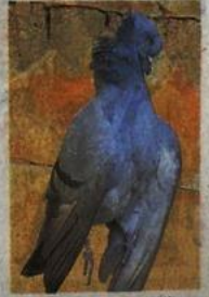
अंबाजोगाई : नायलॉनचा मांजामुळे जखमी झालेले कजुर.

जुलै २०१७ रोजी राष्ट्रीय हरित लवादाने नायलॉन व चायनीज मांजाचा व्यापार, विक्री व वापरावर सख्त बंदी घालण्याचा निर्णय घेतला आहे. या निर्णयाच्या आधारे आता मांजाच्या व्यापार प्रत्यक्षात बंदी आणणे आवश्यक आहे. बंदीच्या आदेशाची मोठ्या प्रमाणात जनजागृती करून मांजाचा व्यापार, विक्री, साठवणूक व वापरावर प्रत्यक्षात कारवाई करावी, अशी मागणी येथील पक्षीमित्र, निसर्गप्रेमींनी केली आहे. या मागणीसाठी शहरातील प्रभास पक्षी मित्र, सामाजिक