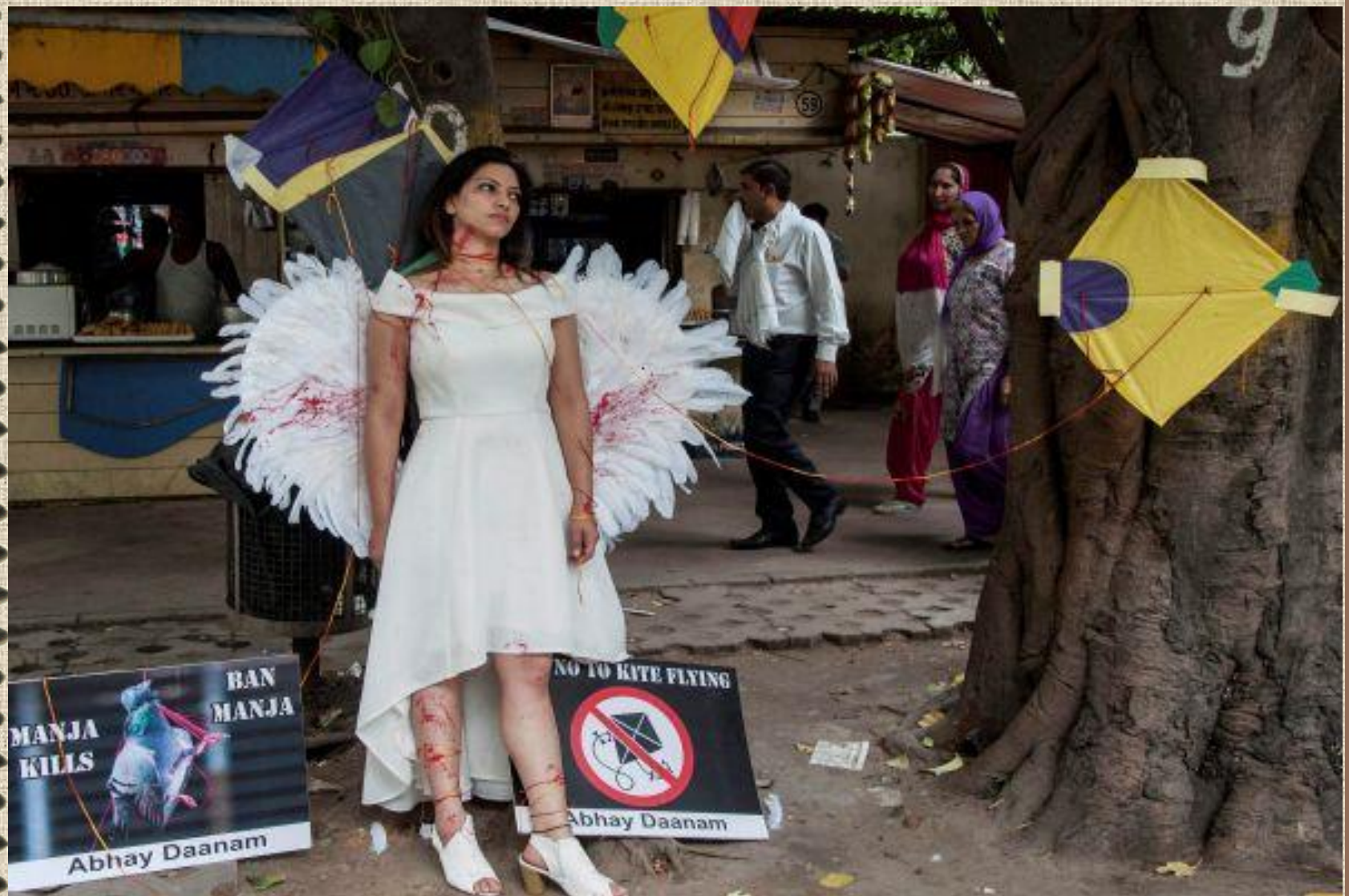
Protest against use of Nylon Manja (New Delhi)