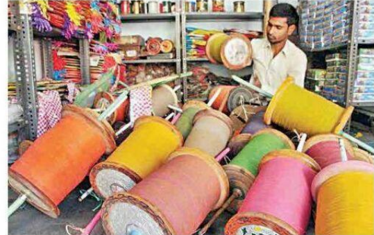
जळगाव ToDay सकाळ १५-७-२०१७

मार्चला महाराष्ट्र शासनाच्या पर्यावरण विभागाने पर्यावरण (संवर्धन) अधिनियम १९८६ कायदा कलम ५ अंतर्गत नायलॉन/ चायनीज मांजावर बंदी घालण्याचे परिपत्रक पारित केले होते. देशभरातील अनेक राज्यांनी सुद्धा अशाप्रकारचा प्रयत्न केला होता. मात्र या मार्गदर्शक तत्वांना कुठलाही कायदेशीर आधार नसल्यामुळे वनविभाग व पोलिस यंत्रणा यांना कार्यवाही करताना अडचण येत होती व त्यामुळेच मांज्याचे व्यापारी व वापरकर्ते यांचेकडून या परिपत्रकाला सर्रास हरताळ फासला जात होता. त्यामुळे याविरोधात राष्ट्रीय हरित लवादाकडे याचिका दाखल करण्यात आली. त्यावर लवादाने त्यावर बंदी घालण्याचा निर्णय दिला आहे. दरम्यान, यासंदर्भात राष्ट्रीय हरित लवादाने दिलेल्या निर्णयामुळे पक्ष्यांचे